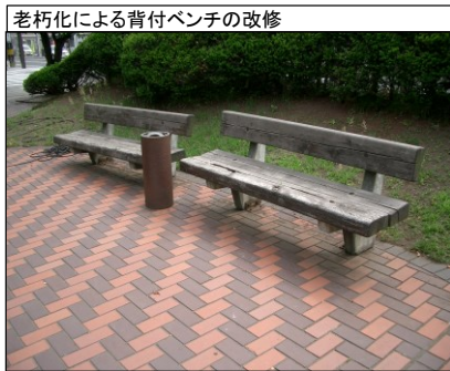
老朽化による背付ベンチの改修