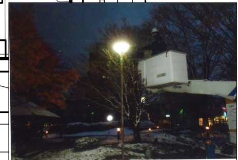
老朽化による照明灯の改修(LED化)