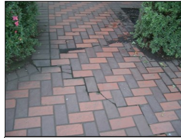
老朽化による園路の改修