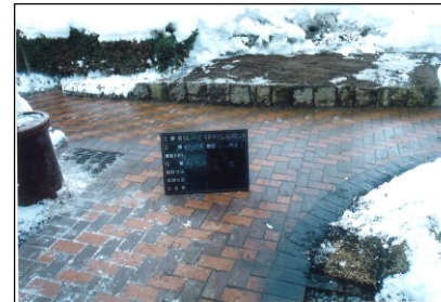
青森地方裁判所弘前支部