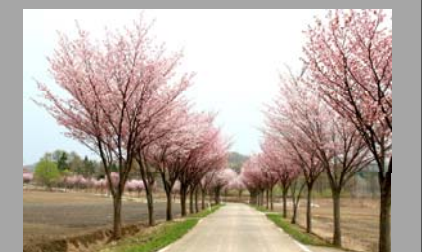
津軽岩木スカイライン 向かいのオオヤマザクラ