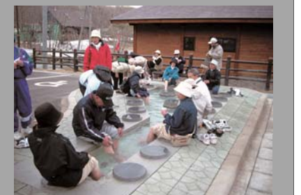
岩木さんぽ館 足湯