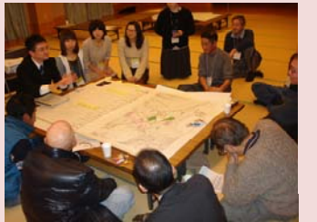
まち育てミーティングの様子