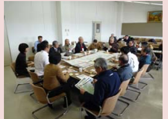
まち育てミーティングの様子