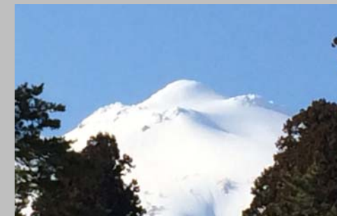
岩木山神社から見た岩木山