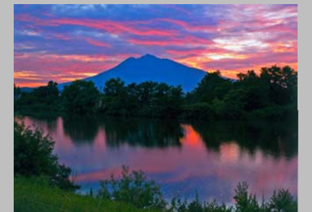
岩木茜橋から見た岩木山