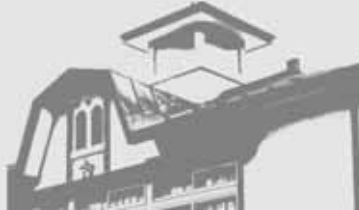
茂森会館消防西第一分団屯所【西茂森1丁目】