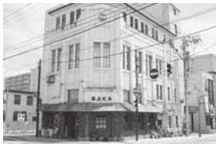
旧弘前無尽社屋(三上ビル)【元寺町】