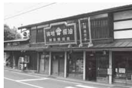
加藤味噌醤油醸造元【新寺町】