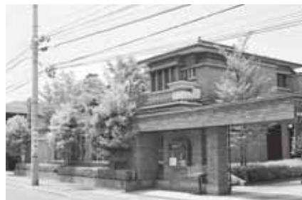
旧高谷家別邸(翠明荘)【元寺町】