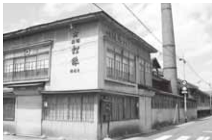
清酒松緑醸造元(株)齋藤酒造店 【駒越町】