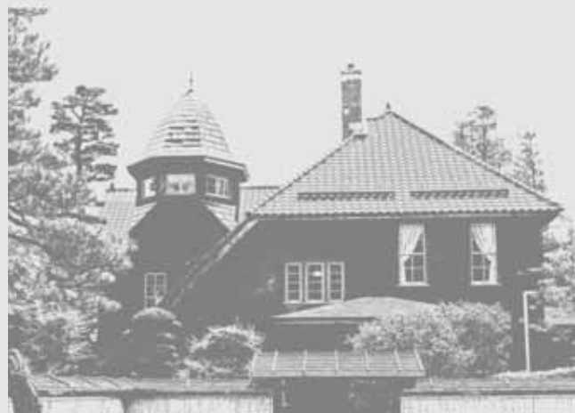
旧藤田家別邸【上白銀町】

趣のある建物指定制度 弘前市には、弘前城をはじめとする歴史的な建造物や、明治・大正期の洋風建築物などの文化財が数多く残されています。また、文化財には指定されていないものの、歴史と文化が息づく情緒豊かな建物も数多く点在しています。 趣のある建物指定制度とは、これら弘前の風情を醸し出している古い建物を「趣のある建物」として指定し、市民や観光客に発信することで弘前の新たな魅力の発見や、文化都市としての奥深さを体感してもらうことを目的としている制度です。