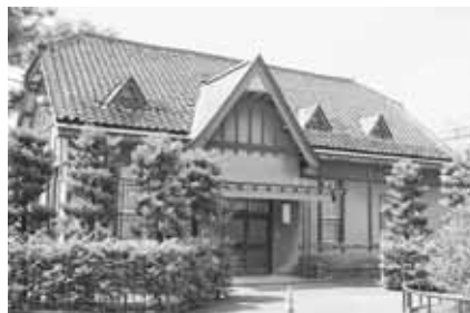
旧第八師団長官舎(弘前市長公舎) 【上白銀町】