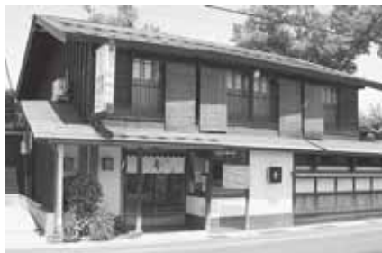
真そばや會【新寺町】