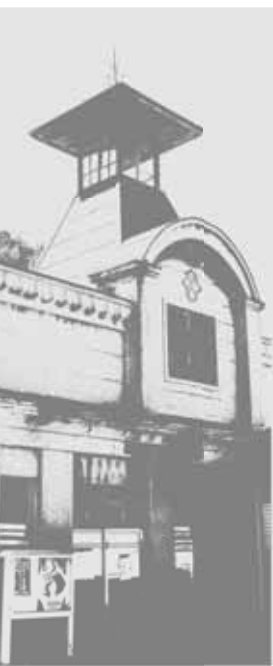
旧弘前市消防団西 地区団第四分団消 防屯所【紺屋町】

市では、趣のある建物の指定と並行して、これらの建物を紹介したガイドマップ「趣のある建物」弘前散策」を作成しました。 このガイドマップでは趣のある建物のほか、弘前公園周辺の文化財、岩木山や五重塔の眺望ポイント、昔ながらの情緒ある小路や坂道など弘前の魅力を紹介しています。また、これらを巡るモデルコースも併せて紹介していますので、ガイドマップを片手に弘前の魅力を再発見してみたいいかがですか。 なお、ガイドマップは市役所や観光案内所などで差し上げています。 ■問い合わせ先 都市計画課計画係 (市内線448)