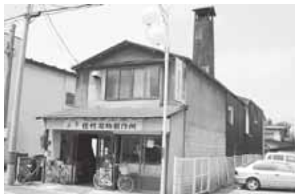
保村打刃物製作所【代官町】