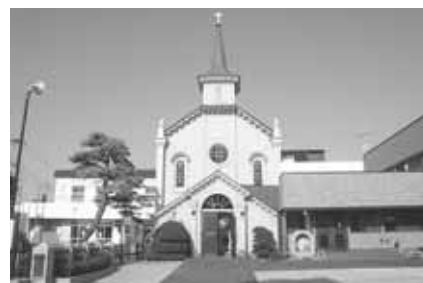
カトリック弘前教会【百石町小路】