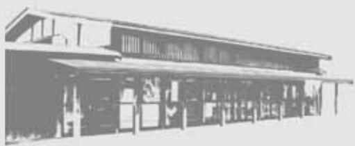
川崎染工場【亀甲町】

市では、趣のある建物の指定と並行して、これらの建物を紹介したガイドマップ「趣のある建物」弘前散策」を作成しました。 このガイドマップでは趣のある建物のほか、弘前公園周辺の文化財、岩木山や五重塔の眺望ポイント、昔ながらの情緒ある小路や坂道など弘前の魅力を紹介しています。また、これらを巡るモデルコースも併せて紹介していますので、ガイドマップを片手に弘前の魅力を再発見してみたいいかがですか。 なお、ガイドマップは市役所や観光案内所などで差し上げています。 ■問い合わせ先 都市計画課計画係 (市内線448)