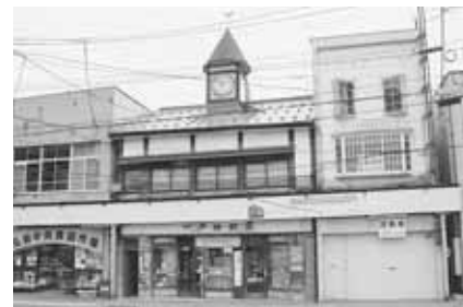
一戸時計店【土手町】