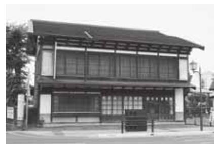
小野金商店【北瓦ヶ町】