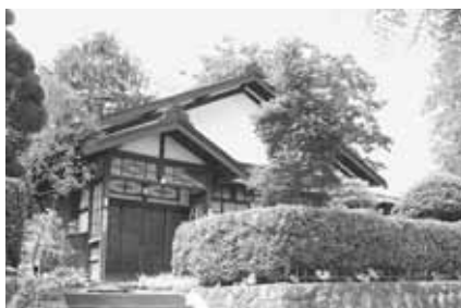
竹田家住宅【下白銀町】