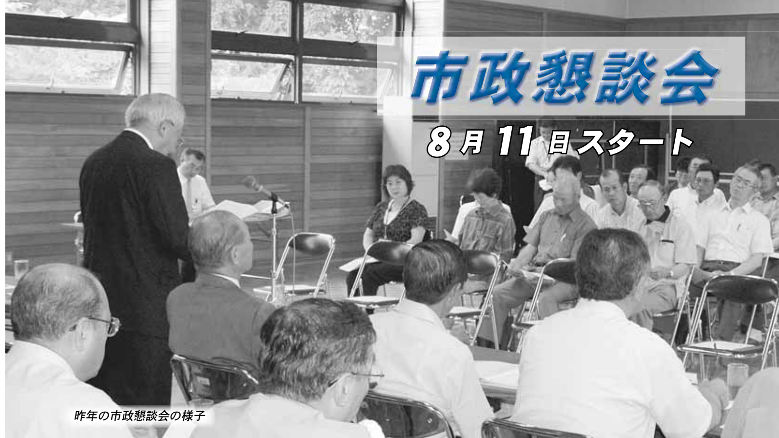
昨年の市政懇談会の様子