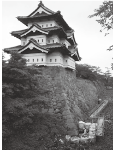
弘前城本丸石垣発掘調査風景