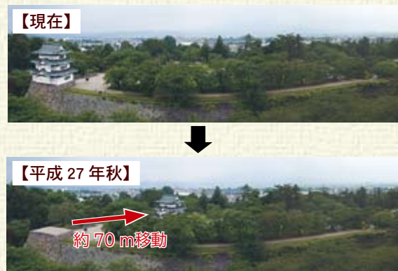
◁天守曳屋工事想定図…天守は本丸中央部へ約70m移動します（予定）。平成27年のさくらまつりまでは、現在の位置にある天守を見ることができます。また、曳屋工事中も本丸へは入場できるようになります。