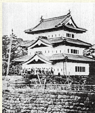
△ 100年前の天守曳屋（大正4年撮影）…100年前には人力で天守を曳屋していますが、今回は機械を用います。

平成28年度には、いよいよ石垣修理に着手します。まず、修理範囲の石垣の全部を解体し、その後南側と北側の2工区に分けて積み直しを行う予定です。初めに南側から積み直し、天守台部分が完成し次第、天守を曳き戻しながら残りの石垣の積み直しを行います。石垣を積み直す際には、発掘調査で得られた情報を基に整備していく方針です。