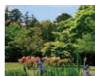
※質問は22ページに掲載。

答えは、③の1,500種類だよ。4月～11月までの開園中、季節ごとに移り変わる植物の様子を観察するのも楽しいね。散策所要時間は約40分～1時間。自由広場でお弁当を広げれば、一日中楽しめるよ！5月29日は年に一度の無料開放日！友達を誘って、みんなで行ってみよう！