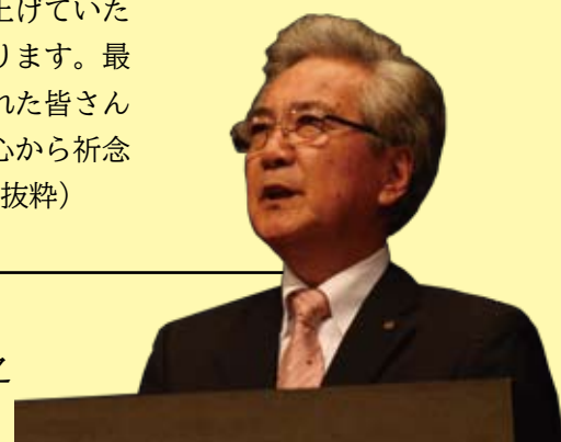
弘前市長 葛西 憲之