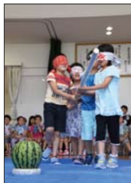
【今号の表紙＋1 枚】 「楽しくておいしい～！」

■問い合わせ先 吉野町緑地整備推進室（☎ 40・7123）、なべげんわーく（☎ 携帯 080・1269・6158〈公演当日連絡用〉）