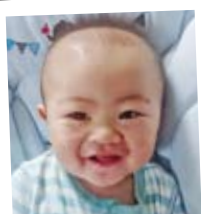
おかもと かづき 岡本 楓月くん H28.9.18 生(津賀野)