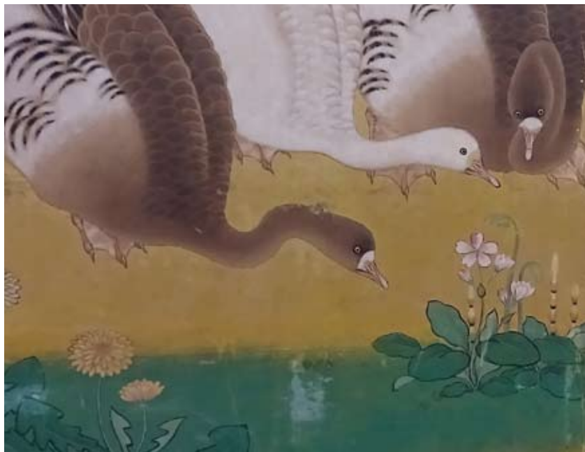
▲狩野岑信「雁之図」（六曲一双屏風部分）