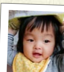
ほりうち ねね 堀内 嶺羽ちゃん H28.12.17 生(境関1)