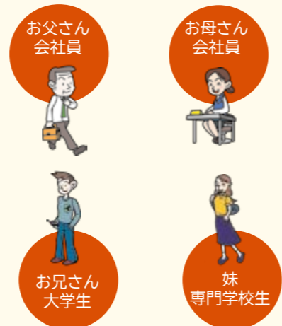
※一例として示しています。

毎年財政状況についてお知らせしていますが、市民の皆さんから「用語が難しい」「ケタが大きすぎてイメージがわからない」など分かりづらいという意見があります。そこで、もっと分かりやすく、身近に感じてもらうために、平成28年度の一般会計決算(3ページに掲載)を一般家庭の家計簿に置き換えてみました。 ※家計簿の1万円が実際の1億円に当たります。( )内は、実際の決算額です。