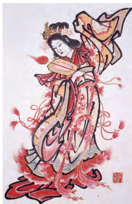
▲竹森節堂筆ねぶた見送り絵『楽女』