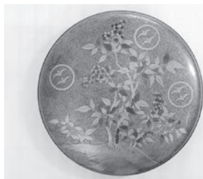
▲御紋付梨地蒔絵鏡箱（当館蔵）