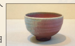
▲りんご釉（ゆう）の茶碗