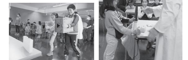
▲これまでの開催の様子

📍弘前地区環境整備センタープラザ棟(〒036-8314、町田筒井6の2、☎ 36-3388、📠 http://www.city.hirosaki.aomori.jp/kankyoseibi/plaza/ 、受け付けは午前9時～午後4時、月曜日は休み(月曜日が祝日の場合は翌日が休み))