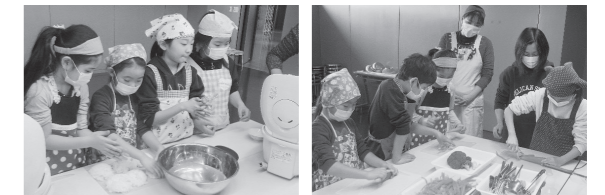
▲これまでの開催の様子

▼申し込み方法 往復はがきに教室名・住所・氏名・年齢・電話番号を記入の上、1月23日(土・必着)までに郵送してください。※往復はがき1枚につき2人まで応募可。応募多数の場合は抽選で決定し、1月30日(土)までに抽選結果をお知らせします。詳しくは、プラザ棟ホームページをご覧ください。