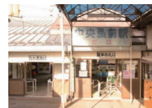
▲中央弘前駅の降車口。駅全体にレトロな雰囲気。津軽尾上～尾上高校前間の車窓からは、陸橋の上からの眺めを楽しめる。