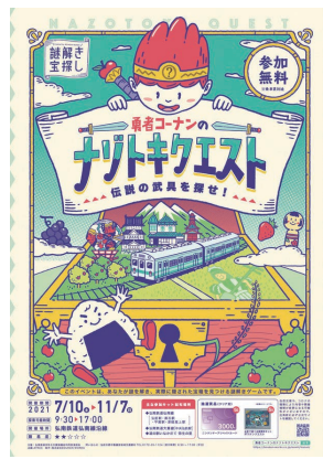
▲「勇者コーナンのナゾトキクエスト」弘南線沿線の謎を解き伝説の武具を探すイベント(11月30日まで延長)