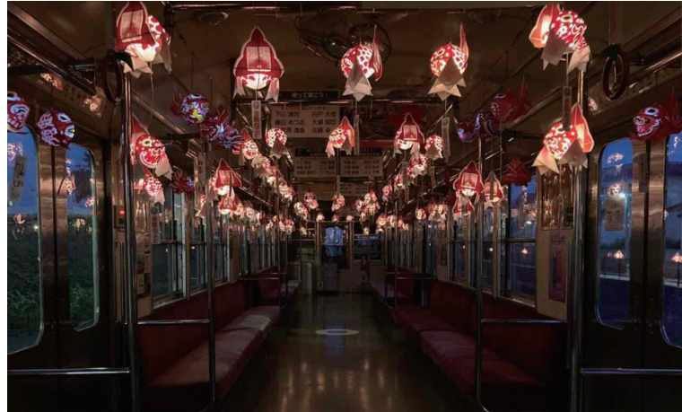
▲子ども金魚がたの列車の車内。制作は沿線の学校の子どもたちによるもの

皆さんが弘南鉄道に触れるきっかけ作りのため、弘南鉄道ではさまざまな取り組みに挑戦しています。アート、伝統文化、グルメ、謎解き、ホラー!? 鉄道の可能性は無限大! ただの移動で終わらない、新しい楽しみ方をあなたも探しませんか。