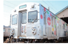
▲りんご畑列車のラッピング