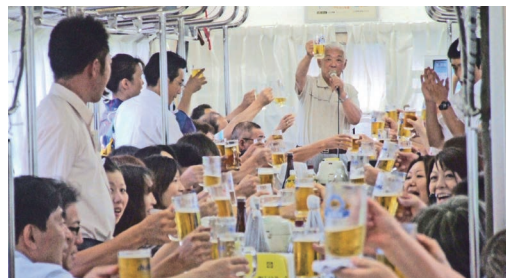
▲飲食を楽しむイベント列車は「納涼ビール列車(7月)」 「忘年列車(12月)」 「けの汁列車(2月)」の年3回(写真は新型コロナウイルス感染症拡大前に撮影したもの/今後開催が中止になる場合があります)