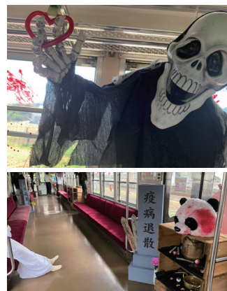
▲今年8月に大鰐線で運行された「お化け屋敷列車」。地元の学生によるプロジェクトで実現