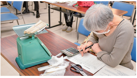
3月15日 ヒロコ（駅前町）

正 しく計量する意義と重要性を学ぶ学習会を開催。参加者は、計量の大切さについて説明を受けた後、スーパーで購入した商品が正確な量となっているか、はかりを使って確認していました。