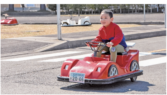
4月1日 城北公園交通広場（田町3丁目）

楽 しみながら交通ルールを学ぶことができる城北公園交通広場が今年度の営業を開始。春風が吹く晴天の下、左右を確認し、信号を守って乗り物を楽しむ子どもたちでにぎわっていました。