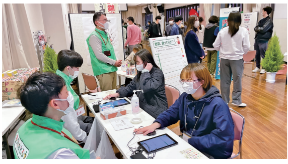
3月26日 土手町コミュニティパークほか

市 民の健康意識の向上を目的にイベントを開催。来場者は、手のひらの色素から野菜の推定摂取量を調べる「ベジチェック」や、生活習慣の改善に役立つQOL健診を受診していました。