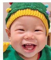
やまもと よう 山本 鷹ちゃん R7.3.9 生