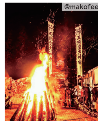
沢田ろうそくまつり

弘前の「いいかも!!」と思う魅力を見つけ、写真を投稿しよう！ #ecomeonhirosaki のハッシュタグをつけて、美しい景色や街の風景を投稿してください。投稿された写真は、市公式インスタグラムや広報ひろさきで紹介することがあります。