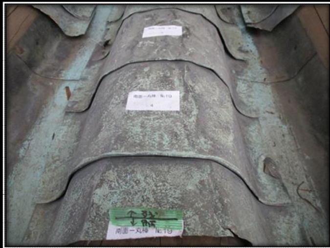
江戸時代後期の銅板（南面）

令和3年11月上旬より工事用の仮設足場を設置し、今回の修理対象である上層屋根の銅板をすべてはがし、下地木部の状況を確認しました。二の丸南門では、昭和33年（1958）に上層屋根を部分的に、下層屋根を全面的に葺き替えしています。