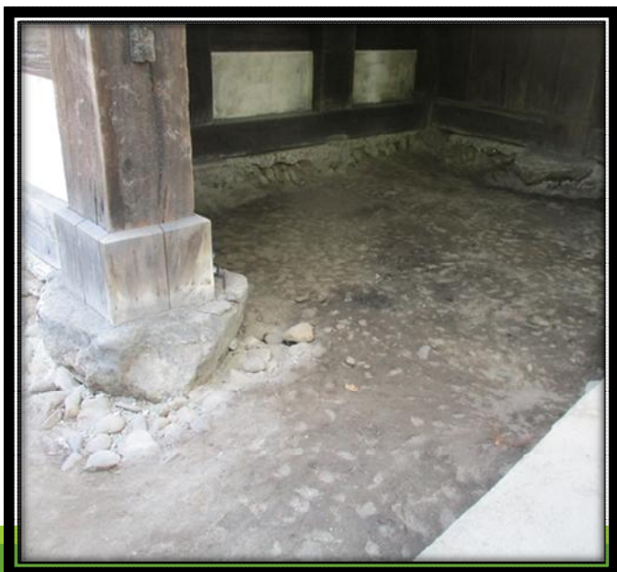
江戸時代の盛土（黒色土）

調査の結果、二の丸南門の土間コンクリート叩き〔昭和33年(1958)設置〕の下には人頭大の円礫が一面に敷かれ、その円礫を取り外すと江戸時代の盛土（黒色土）が出てきました。円礫は昭和の敷設と考えられるとともに、江戸時代の黒色土までの深さは約30cmで、昭和の修理の際には江戸時代の地層をここまで掘り込んで工事をしたものと思われます。