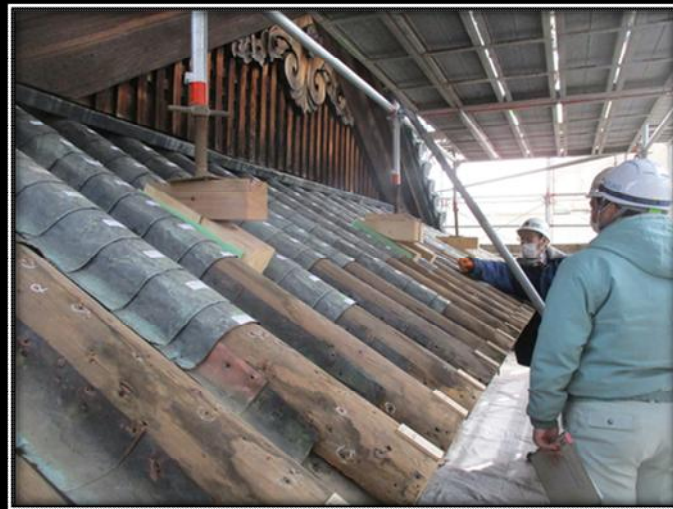
妻面に残る江戸時代後期の仕様（南面）