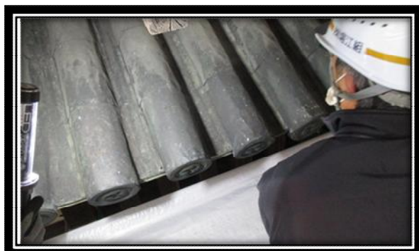
庇の屋根は江戸時代の様相を残す

屋根に付く鯨〔しゃち〕・鬼板〔おにいた〕についても、表面の銅板をはがして中の木部を確認しました。鯨の下地には杉材が用いられており、銅板内部で腐食している様子が確認されました。