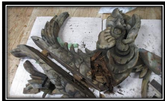
鯨の下地木部（東側の鯨）