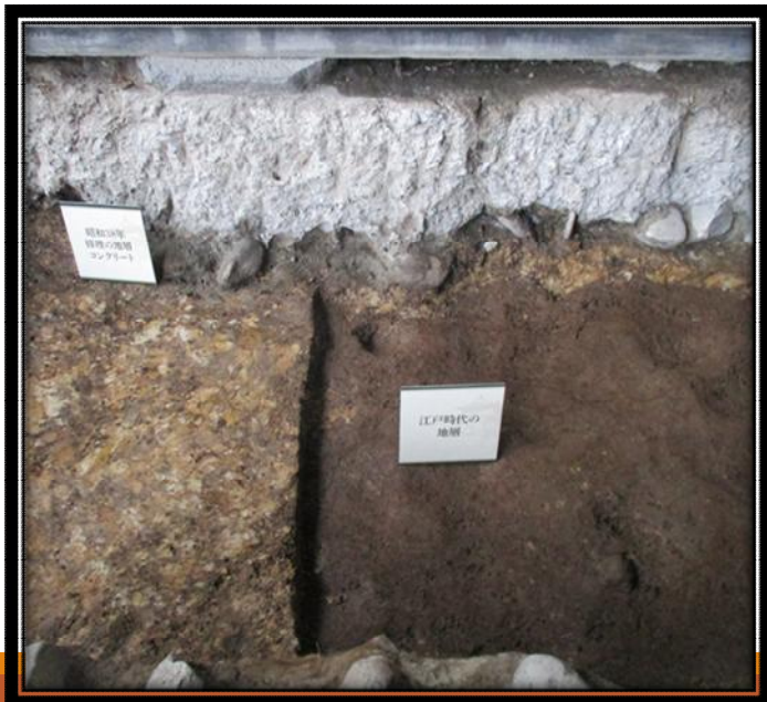
江戸時代の黒色土（写真右）

調査の結果、追手門の土台下には外周を巡るコンクリート基礎が施工されており、昭和38年（1963）の補強であることが分かりました。江戸時代の盛土（黒色土）はコンクリート基礎の下、現在の土間コンクリート叩き面から下に65cmの深さで検出されています。江戸時代の黒色土は本来、現在の地面に近い高さまで残っていたものと思われませんが、昭和38年に65cmに渡り掘り込まれ、その穴の中にコンクリート基礎が施工されたことが分かりました。