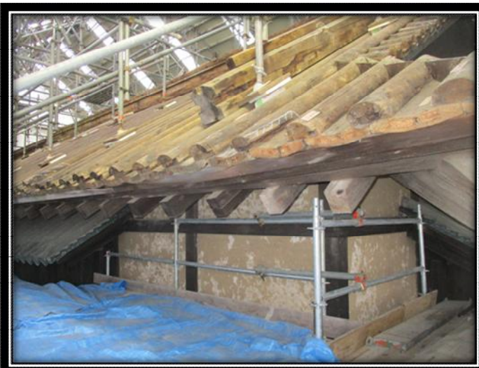
銅瓦葺き屋根（南面：南東から）