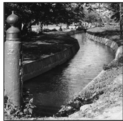
【昭和35年の波祢橋親柱】

波祢橋は西の郭と四の丸を結ぶ、二階堰にかかる橋です。「津軽弘前城之絵図」には描かれていませんが、幕末には橋の名称が古文書に記されるようになります。幕末の橋の形状は不明ですが、昭和35年<1960>の写真を見ると【右写真】、この頃には親柱に色が塗られ、擬宝珠（ぎぼし）もあったようです。