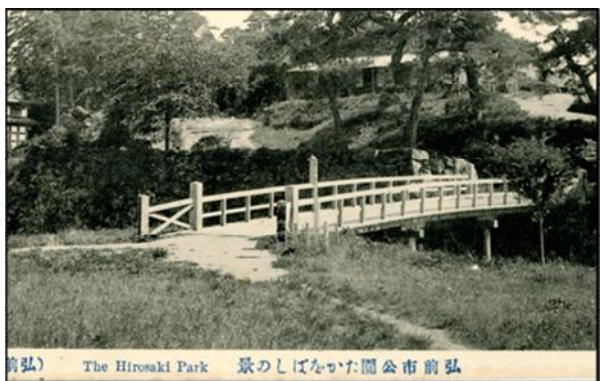
【明治28年<1895>以降の鷹丘橋】