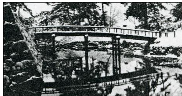
【明治時代の鷹丘橋〔公園開園前か〕】