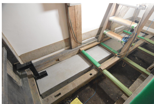
城門土台下の耐震補強〔三の丸追手門1階〕