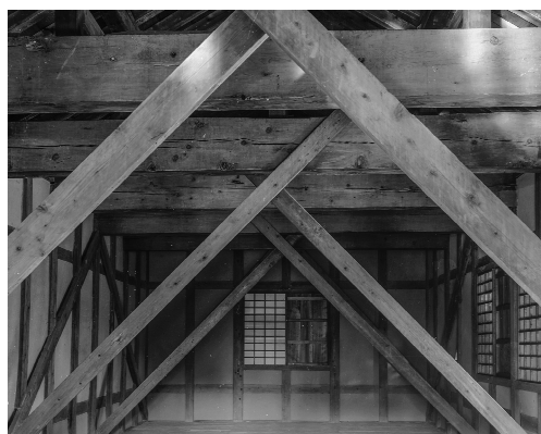
修理前の筋違い〔二の丸南門2階〕