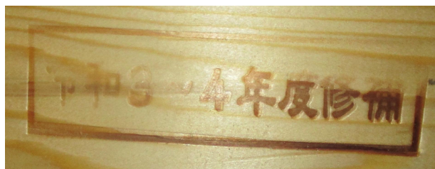
新たな筋違いへの焼印

また、新たな筋違いには、設置年が分かるよう「令和3～4年度修補」の焼印を押してあります。