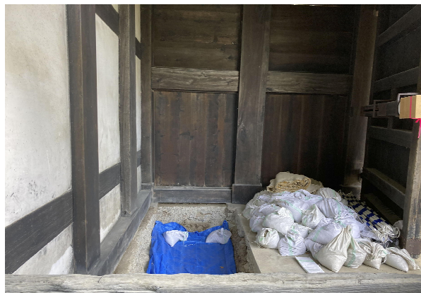
耐震補強前〔三の丸追手門東内壁〕