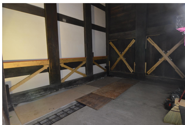
筋違いとおもりを追加 〔三の丸追手門東内壁〕