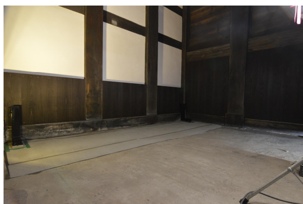
耐震補強完了〔三の丸追手門東内壁〕