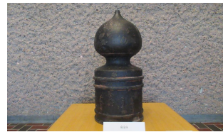
【写真1】弘前市立博物館所蔵 擬宝珠