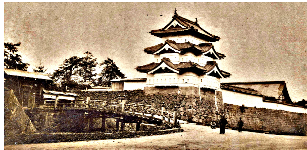
【写真2】江戸時代初期の下乗橋