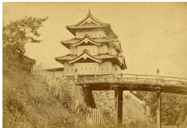
【写真3】昭和20年代の下乗橋