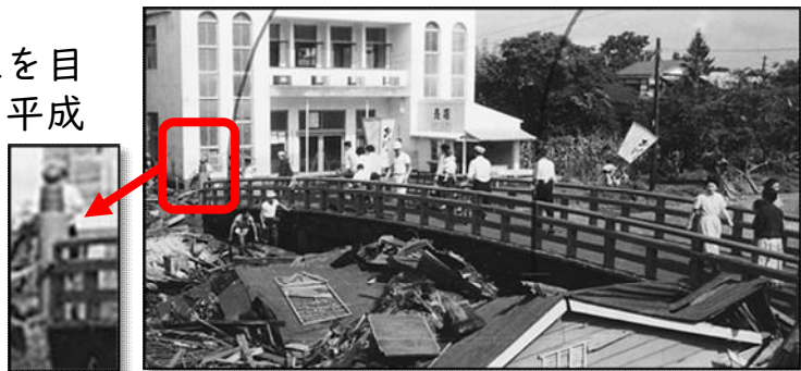
【昭和33年<1958>水害時の春陽橋】