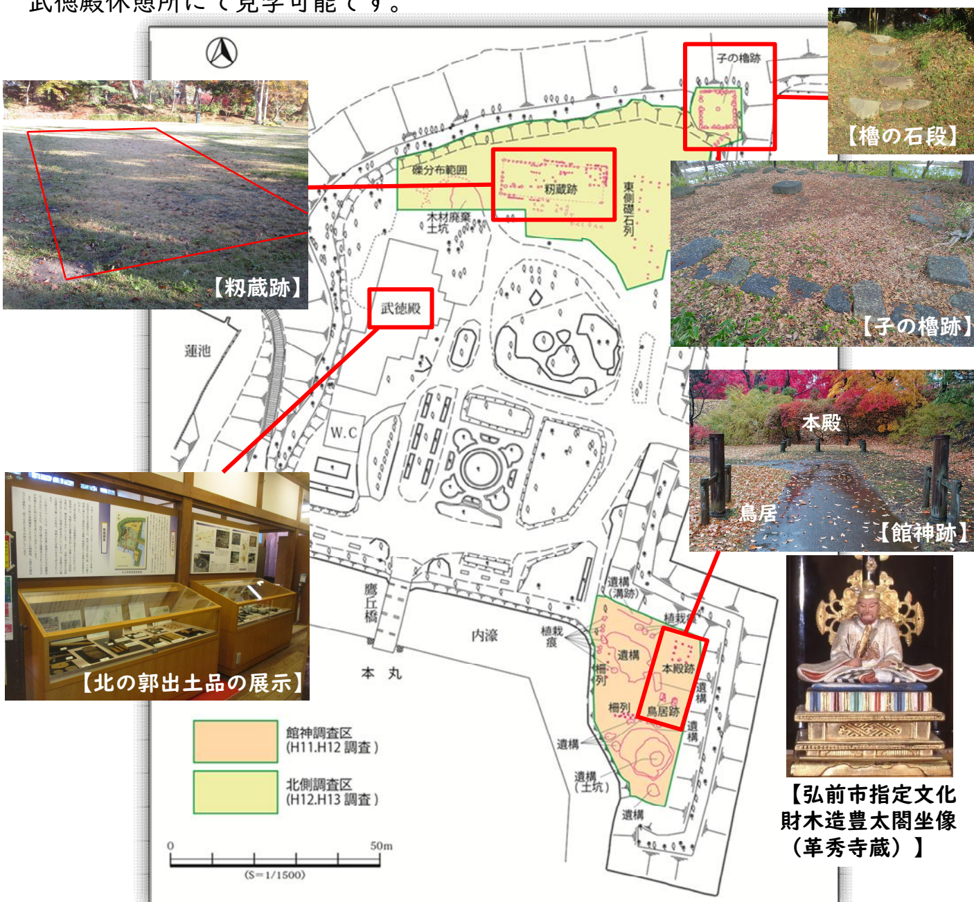
【図2】北の郭の発掘調査位置（平成11～13年当時）と遺構整備状況

現在、子の櫓跡については実物の礎石列を露出展示し、靱蔵跡や館神跡については礎石や木柱を復元して遺構の位置を示しています。発掘調査の出土品は、武徳殿休憩所にて見学可能です。