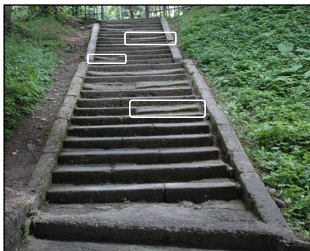
【写真4】整備前の石段【平成25年（2013）】