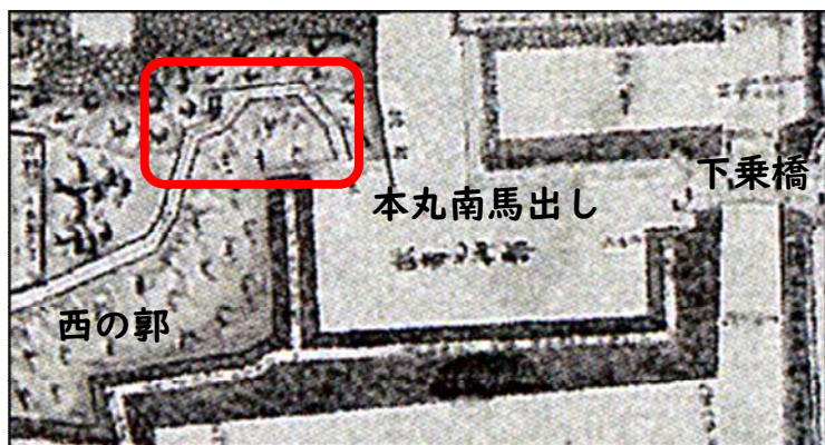
【図3】文化2年（1805）御城郭分間真図【部分】

平成29年度の整備工事では、上段に可能な限り元の石材を再利用して修理前と同じ形状の石段を整備し【写真6】、下段には岩木山で採取された安山岩と豆砂利舗装を用いて、全体的に史跡景観と調和するように仕上げました。