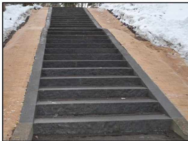
【写真6】整備後の石段【平成30年（2018）】