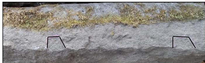
【写真5】石材に残っていた矢穴【黒線でトレース】