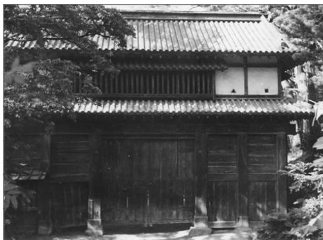
【写真2】昭和32年の二の丸東門