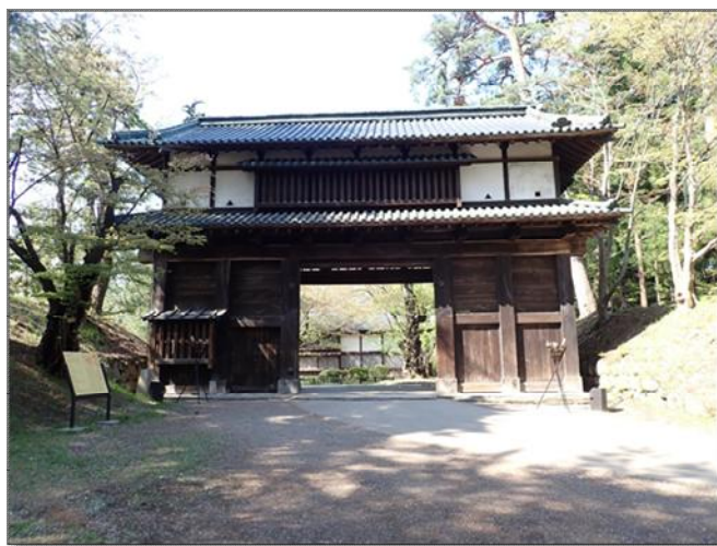
【写真1】現在の二の丸東門（南から）