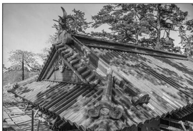
【写真3】昭和33年の修理後の二の丸東門上層屋根