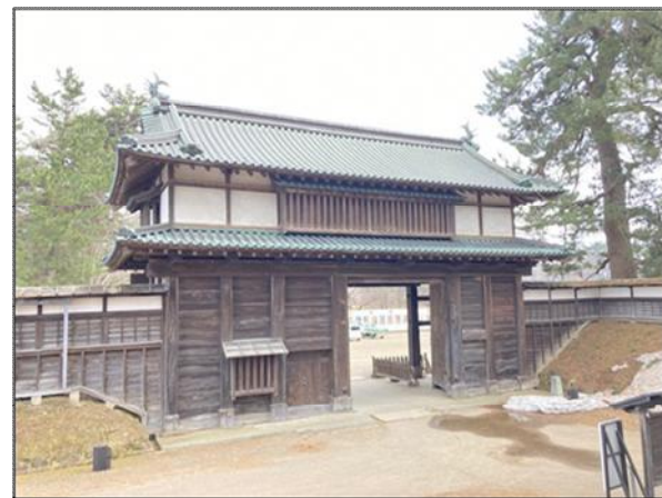
【写真1】現在の北の郭北門(亀甲門)