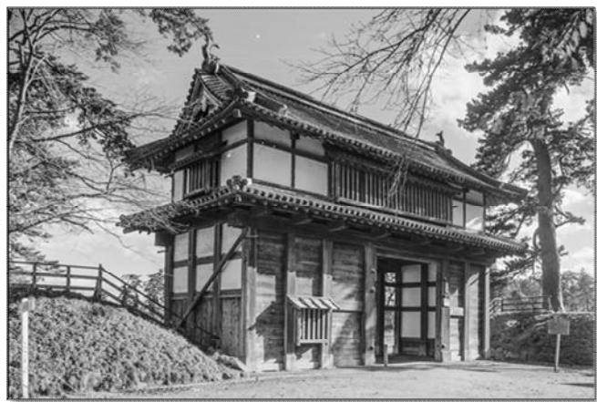
【写真3】昭和31～32年の大修理前の北の郭北門