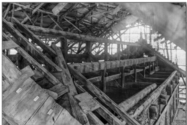
【写真2】昭和31～32年の大修理中の母屋