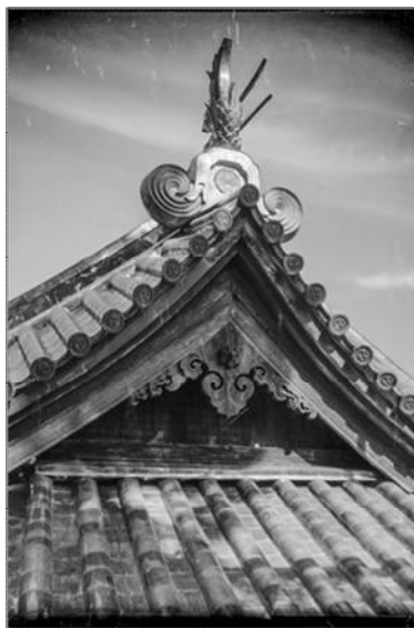
【写真4】昭和32年の修理後の妻側屋根