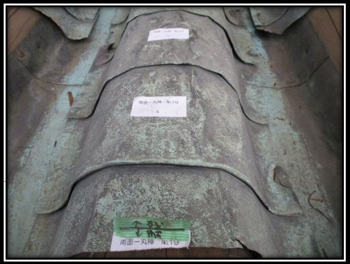
妻面に残る江戸時代後期の仕様（南面）