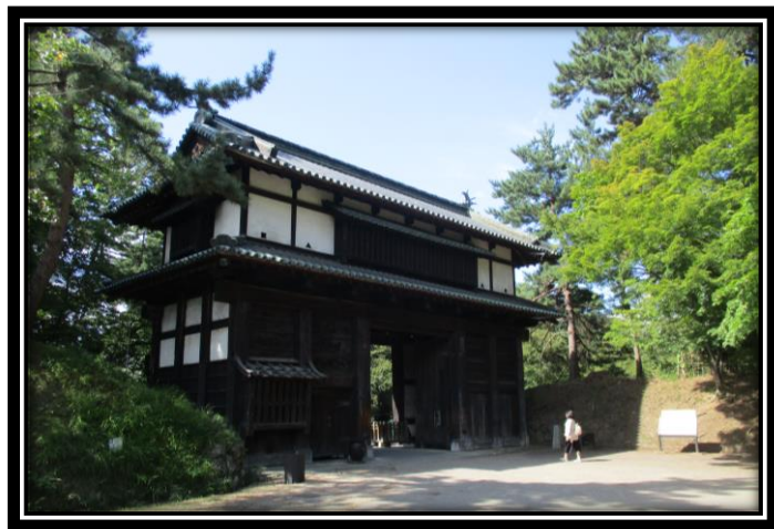
弘前城二の丸南門

二の丸南門は耐震診断の結果、大地震で浮き上がる恐れがあると判明したため、土台下にカウンターウエイト(おもり)を埋設する耐震補強を実施します。この門は弘前城築城の慶長16年(1611)頃の建物と考えられ、地下に江戸時代の遺構が残っている可能性もあることから、事前に発掘調査を実施しました。