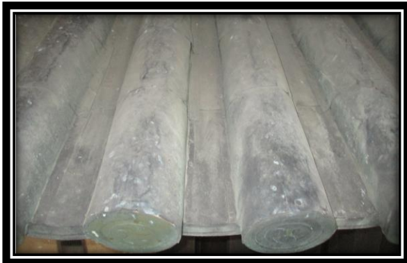
庇の屋根は上層屋根妻面よりも古い

銅板をはがしたところ、屋根下地木部の状態は概ね良好でしたが、部分的に昭和33年修理時のルーフィング(雨漏り防止シート)が確認されました。昭和に修理できなかった部分と思われることから、今回新しい木材も用いて修理します。