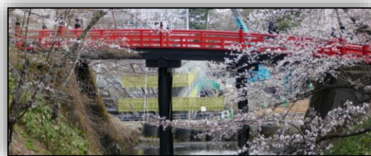
【写真2】現在の下乗橋