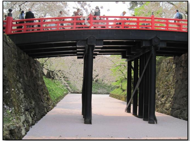
【写真5】 現在の下乗橋の橋脚

次に、橋脚を見てみましょう。現在の8橋では、すべての橋脚がコンクリートパイル製となっています。かつての橋脚は木柱でしたが、当時は木材の腐食が橋の強度に直結するため、橋脚の交換頻度が多く、毎回大がかりな工事になっていたと考えられます。しかし、昭和35年<1960>に下乗橋の橋脚をコンクリートパイルに変更した工事を代表格に、弘前公園内の橋脚は逐次コンクリートパイルに変更されました。現在では、上部木材の更新を行うだけで橋の強度が保たれるようになっています【写真5】。