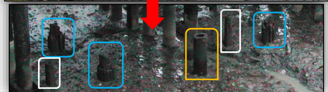
【写真6】 昔の鷹丘橋の橋脚（2004年撮影）

※写真6下の白・青・黄色の枠線は、各柱の組み合わせを示す。同色で囲まれた柱は、同時期のものと考えられる。