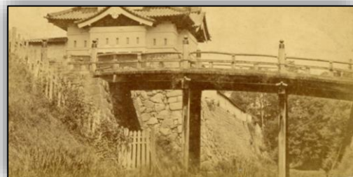
【写真1】明治時代の下乗橋

また、「公園の橋」として昭和8年<1933>に新設された一陽橋も元々は白木の橋でしたが【写真3】、現在は緑色に塗られています【写真4】。形状も、設置当初から変化しているようです。