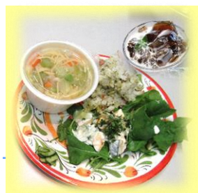
調理例 (昨年の教室より)