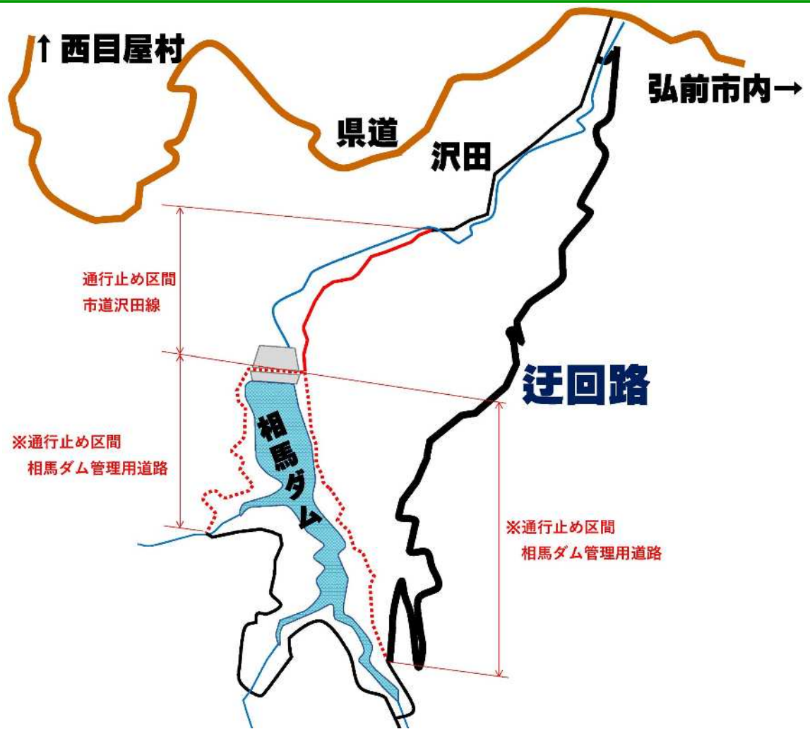
【 迂 回 経 路 図 】