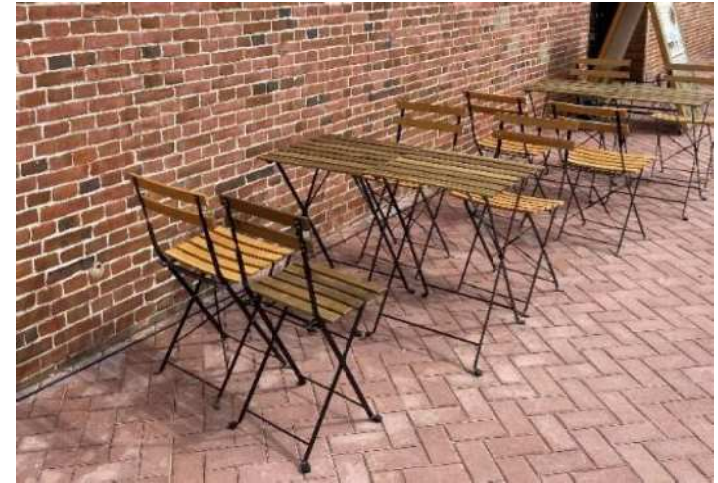
使用するイステーブルのイメージ