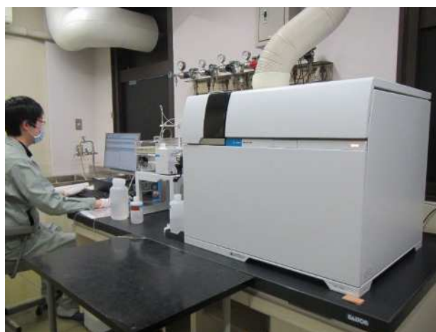
誘導結合プラズマ質量分析計（金属類の測定）