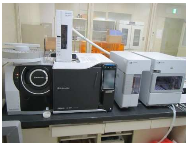
ガスクロマトグラフ質量分析計（カビ臭等の測定）

自己精度管理に取り組むとともに、厚生労働省や県が実施している水道水質外部精度管理に参加し、検査精度の向上に努めています。