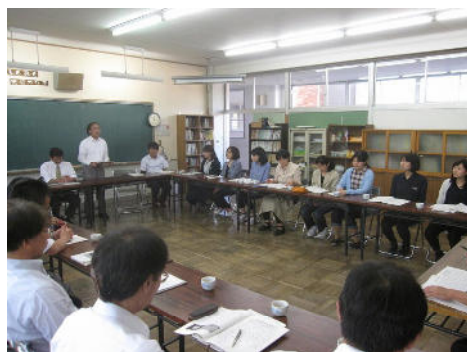
小中の教師が一同に集まって全体会 今後の交流活動について確認

東目屋中学校区では、相互の授業参観や協同での授業づくり（乗り入れ授業）、児童生徒の交流活動に対する打ち合わせなどを通して、先生方も交流する機会を多く持つようにしています。先生方が気軽に相手の学校と行き来できてこそ、9年間を通した子どもへの支援ができるのではないかと思います。