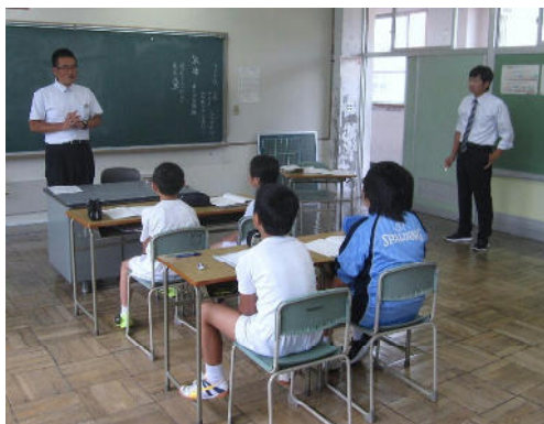
乗り入れ授業 5年生国語 敬語について中学校教師の体験談を聞く

小中一貫教育成功の秘訣は、児童生徒の交流だけでなく、小中学校の先生同士の交流（簡単に言えば小中の先生方が仲良くなること）であるといわれます。小学生と中学生ということで発達段階が違うため、学習や生活面で指導に違いが見られます。この違いをお互い十分に理解していないと、「もっと小学校で基本を身につけてほしい」、「小学校で良かったのに、どうして中学校に行くと崩れるのか」というように相手のことを非難しがちになります。