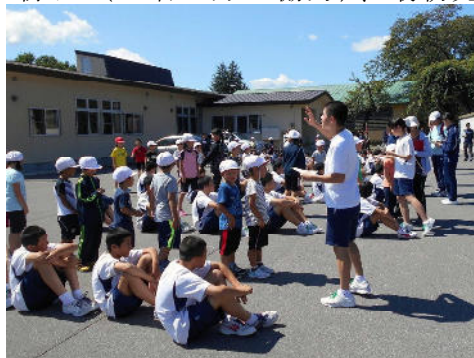
誘導、整列させる中学生