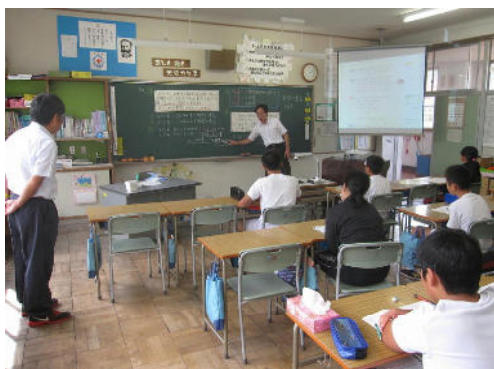
乗り入れ授業 6年生算数 速さについて中学校教師の説明を聞く

このような非難をなくするためには、それぞれが相手のことをよく知ることが大切です。「小学校ではどこまで指導してきているのか」、「受験のある中学校ではどんな指導をしているのか」などよく理解した上で、自分たちの学校の子どもに対応していく必要があります。