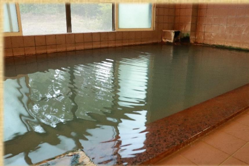
湯質が評判の 三本柳温泉