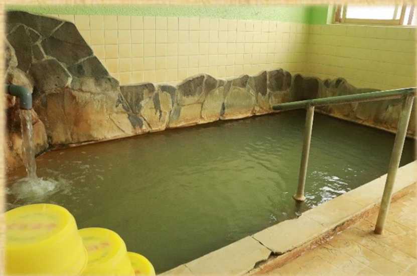
岩木山神社を囲む 百沢温泉郷