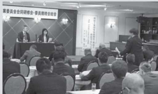
講師へ積極的に質問する委員

総会後の農業委員と農地利用最適化推進委員による合同研修会では、青森地方法務局登記部門職員を講師に迎え、令和5年にスタートした相続土地国庫帰属制度の概要や、相続登記の重要性について説明を受けました。参加した委員は、今後の農業委員会活動に役立てるため、熱心に耳を傾けていました。