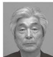
きむら きゅうえい 木村 久榮 【土地改良区】