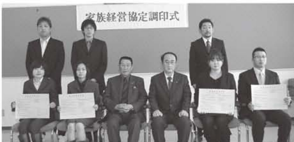
合同調印式の様子

農業経営の方針や役割、休日などについて家族で取り決めて文書化する、家族経営協定の合同調印式が2月21日、中央公民館岩木館で開かれました。 平成25年2月に締結する5家族のうち、調印式には4家族7名が出席。決意を新たにされました。 本市での家族経営協定締結数は、平成25年2月末現在で95戸となります。