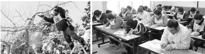
せん定や筆記試験に集中する参加者たち

この講習会兼競技会は、せん定の技術の向上と参加者同士の交流を目的として毎年開催されているものです。今年は24歳から37歳までの28人が参加しました。競技は3人1組による団体の部（9団体）と個人の部で行われ、せん定の実技とりんごに関する知識を問う筆記との総合評価で順位が決まります。