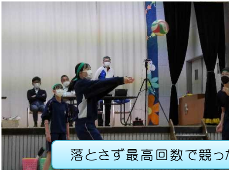
落とさず最高回数で競った「バレーボール円陣パス」

例年、8月の北中祭の中で開催していましたが、熱中症の危険性を考慮し、今年度から春の開催としました。当日は雨となり、室内での開催となりましたが、勝利を目指してたいへん盛り上がりました。