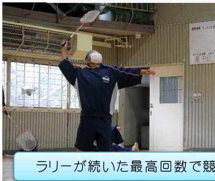
ラリーが続いた最高回数で競った「バドミントン対面ラリー」