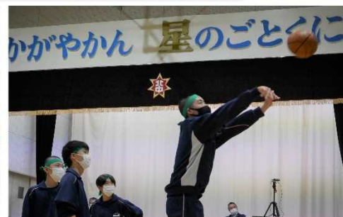
ゴールに入った合計で勝敗を競った「フリースロー対決」