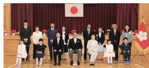
晴れやかな笑顔で記念写真