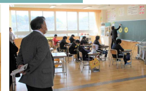
参観日の授業を参観していただきました

参観日にあわせて第1回学校運営協議会が開催され、校長の学校経営方針や今年度の学校運営計画について話し合われました。今年度の委員の皆様は次の通りです。