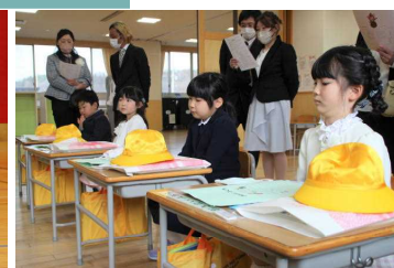
はじめての教室 少し緊張気味

4月6日（木）、入学式が行われ4名の新入生が裾野小学校の仲間入りをしました。慣れない環境でしばらくの間は緊張気味だった1年生も日を追うごとに元気を発揮しています。また、お世話係として6年生が毎日1年教室に向かい優しく話しかけています。