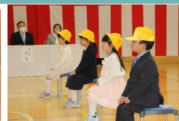
とってもお行儀よかった新入生