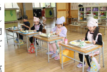
はじめての給食はカレーでした

4月6日（木）、入学式が行われ4名の新入生が裾野小学校の仲間入りをしました。慣れない環境でしばらくの間は緊張気味だった1年生も日を追うごとに元気を発揮しています。また、お世話係として6年生が毎日1年教室に向かい優しく話しかけています。