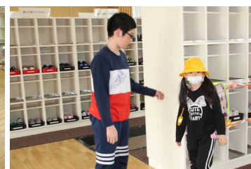
朝、玄関で6年生に迎えられます