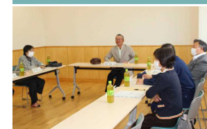
学校運営へのご助言ご指導をいただきました