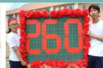
赤組大健闘 準優勝