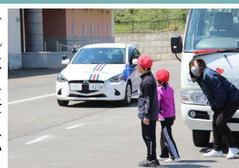
車の陰から道路に出るときは特に注意!

5月9日(火)、弘前モータースクールさんによる交通安全教室が実施されました。今年度2回目となる同教室は自動車の合図や駐車車両の死角などについて実地訓練が行われました。代表で実地体験した児童はもちろん、全員がこれまでわからなかった危険について知り、自分の命を守るための方法をよく学んでいました。