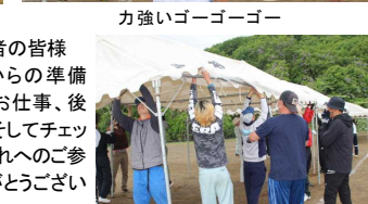
力強いゴーゴーゴー