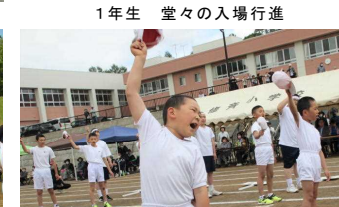
1年生 堂々の入場行進