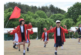
大盛り上がり☆よさこい