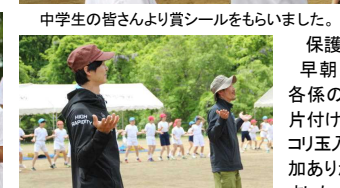
中学生の皆さんより賞シールをもらいました。