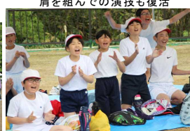
綱引き勝利に歓喜あふれる

保護者の皆様 早朝からの準備 各係のお仕事、後 片付けそしてチェッ コリ玉入れへのご参 加ありがとうございました。