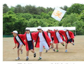
肩を組んでの演技も復活