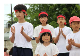
小中いっしょに応援