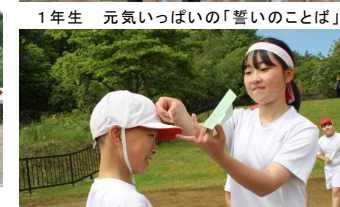
1年生 元気いっぱいの「誓いのことば」