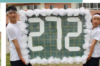
白組みごとに優勝!