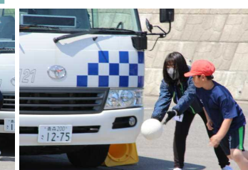
ボールを取りにいこうと飛び出すのは危険!