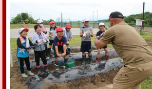
おいしく育つための儀式です