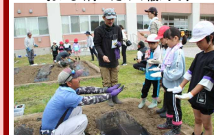
苗を植える間隔は手のひらではかろう

5月26日(金)にJ A 青年部の皆様のご指導で農園開きを行いました。とてもやさしいお声がけのおかげで、子供たちはみんな笑顔で作業し、「おいしくなあれ」と豊作を願っていました。