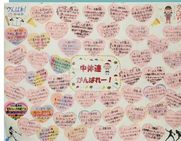
小学校から中学校へ