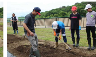
上学年は歌づくりも学びました