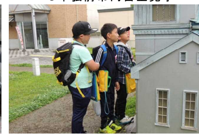
ミニチュア建造物「よくできてるなあ」

1年生から5年生はそれぞれ校外学習に出かけ、学校では味わうことのできないいろいろな活動を体験してきました。さらに9月には6年生の修学旅行、10月には5年生の自然教室が計画されています。