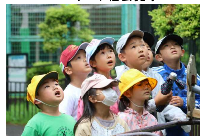
弥生いこいの広場 サルの動きに釘付け