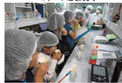
ゴールドバック見学「りんごジュース最高！」