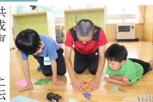
お兄さんは優しく教えてくれました

参観日で披露した七夕飾りは高学年の子供たちが下の子に飾りの折り方をおしえ、完成させました。お兄さんお姉さんのやさしい声がけに下の子はうなずきながら熱心に作り、できあがったときは歓声をあげていました。今回教わった低学年の子が高学年になったときに下の子をお世話する、といった良い伝統が裾野小学校には根付いています。