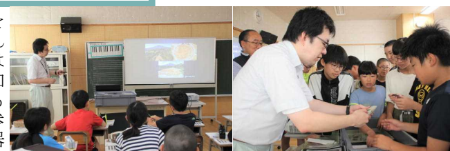
大森勝山遺跡の「なぜ」を学びました 本物に触れる貴重な体験をしました

7月19日(水)文化財課の東海林さんを講師に5、6年ちびっ子縄文講座が実施されました。8月の大森勝山じょうもん祭りには夏休み中にもかかわらず45名の児童が参加するということからも地域愛の高さがわかる子供たちです。縄文講座にも目を輝かせて参加していました。特に今回は本物の縄文土器や矢じりにさわることができるという今後2度とないであろう貴重な体験ができました。