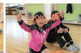
難しい折り方にも挑戦「できたあ!」