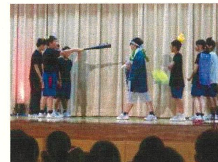
バラエティーショー 1年