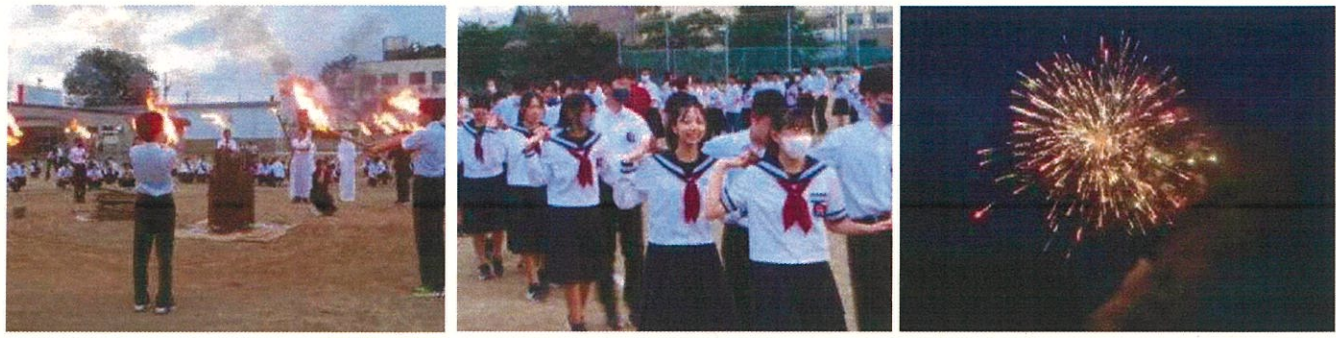
サンセットフェスティバル