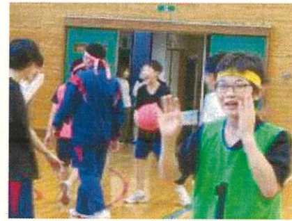
10月24日(木) 1学年レクリエーション

三中学区の子ども像(15歳の姿) 地域を思い、未来に向かって主体的に学び、心身ともにたくましい子ども