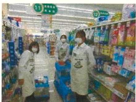
10月23日(水)・24日(木) 職場体験学習

三中学区の子ども像(15歳の姿) 地域を思い、未来に向かって主体的に学び、心身ともにたくましい子ども