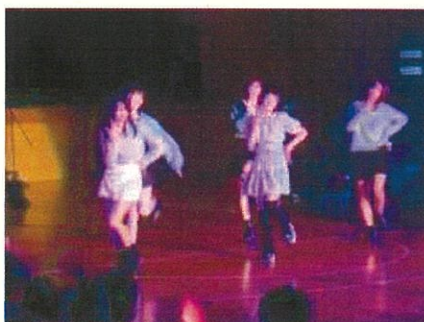
9月26日(木)・27日(金) 三中祭