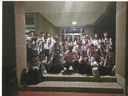
8月25日(日) 吹奏楽部東北大会