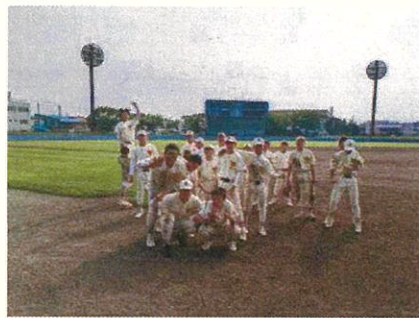
8月18日(日) ※写真は県中体連 県少年軟式野球大会