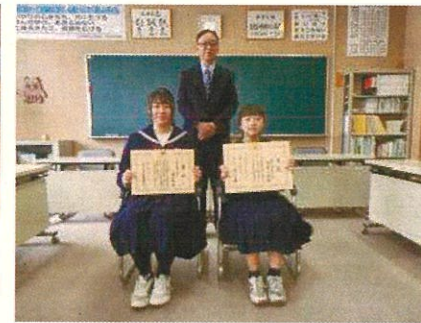
11月19日(火) 納税作品展表彰