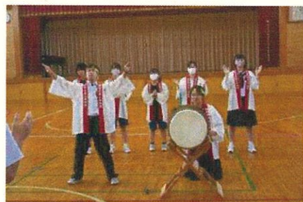
9月7日(土)・8日(日) 地区中体連秋季大会