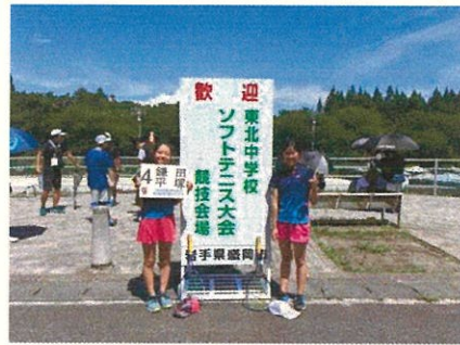
8月9日(金) ソフトテニス部東北大会