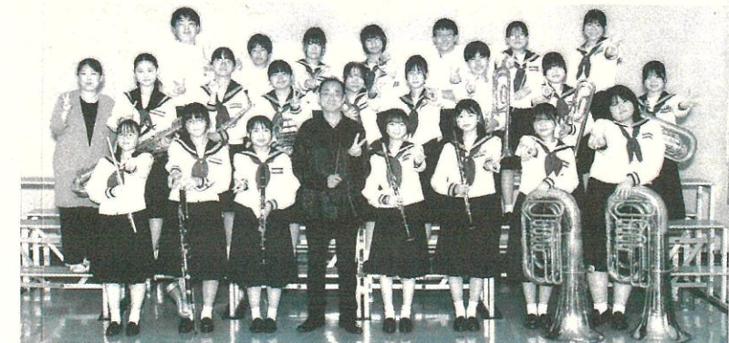
9月11日(水) 第62回吹奏楽部定期演奏会