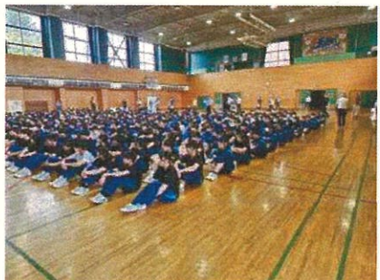
8月28日(水) 水害を想定した避難訓練