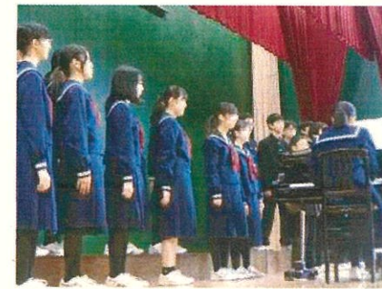
11月1日(金) 校内合唱コンクール