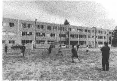
グラウンドにも熱気が戻る(サッカー部)

新年度が始まり、約二ヶ月になろうとしています。この間、保護者の皆様には、本校の新型コロナウイルス感染防止対策に、御理解と御協力をいただき、心から感謝いたします。 各御家庭では、午前授業や臨時休業により、子どもたちの学習環境や一日のリズムが大きく変化したことを心配されたと思います。また、外出の自粛や、行事・イベントの中止・延期等、見通しが立たない困難な