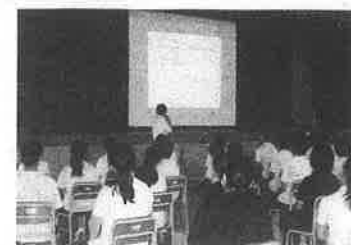
桜守の知恵に学ぶ(3学年)