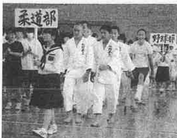
きっと輝く舞台が来る！ 頑張れ、三中柔道部

7月18日(土)より、ソフトテニス・バレーボール競技を皮切りに、いよいよ地区中体連が始まりました。