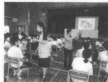
胎児の成長を実感(1学年)

本校では、いのちの大切さや、思春期の心と身体の変化や、異性の立場等について、深く考える機会とするため、「思春期教室」を全学年で実施しています。