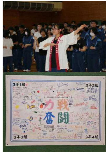
《3年生からのメッセージ》