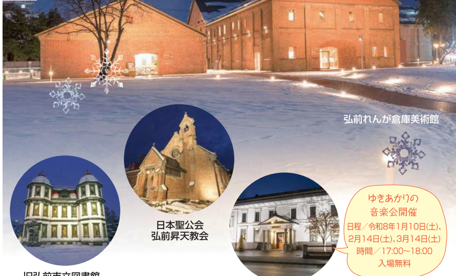
弘前れんが倉庫美術館