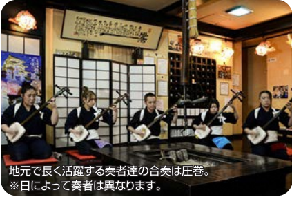
地元で長く活躍する奏者達の合奏は圧巻。 ※日によって奏者は異なります。