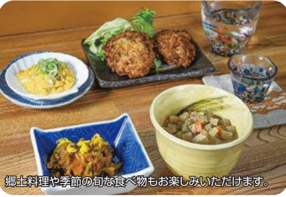
郷土料理や季節の旬な食べ物もお楽しみいただけます。

家庭料理を中心としたほっとする味わいの料理とともに津軽三味線の生演奏が聴ける居酒屋。毎日2回演奏しております。生演奏とともに津軽を感じてください。(ご予約は必須です)