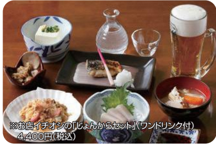
※お店イチオシの「じょんからセット」(ワンドリンク付) 4,400円(税込)

ステージと客席がとても近く、津軽三味線全国大会入賞者の迫力ある演奏を間近で堪能することができます。弘前のソウルフード「イカメンチ」や様々な郷土料理、各種地酒を満喫できます。おすすめです。お昼も承ります(要予約)。