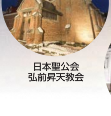
日本聖公会 弘前昇天教会