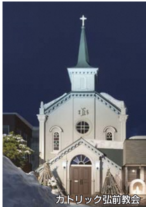
カトリック弘前教会

コース／弘前市立観光館インフォメーション(集合)→追手門広場→旧第五十九銀行本店本館→日本基督教団弘前教会→カトリック弘前教会→弘前市立百石町展示館→かくみ小路→日本聖公会弘前昇天教会→弘前市まちなか情報センター