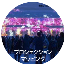
プロジェクション マッピング

りんごのまち弘前の冬を彩るりんごねぶたをお楽しみください。約2mの巨大りんごも登場します。 ●場所／弘前公園 追手門付近 ほかにもたくさんのイベントを行います!